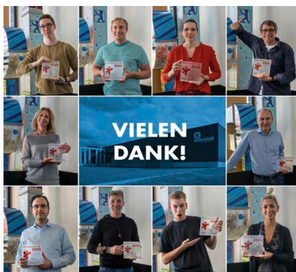
Das Team der MEZ-Technik bedankt sich für die Auszeichnung